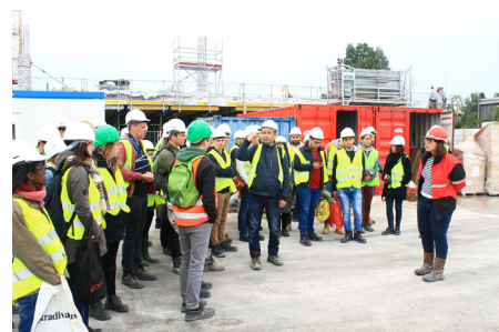
Visite de chantier

Illustrations de quelques exemples d'utilisation de la taxe d'apprentissage 2019.